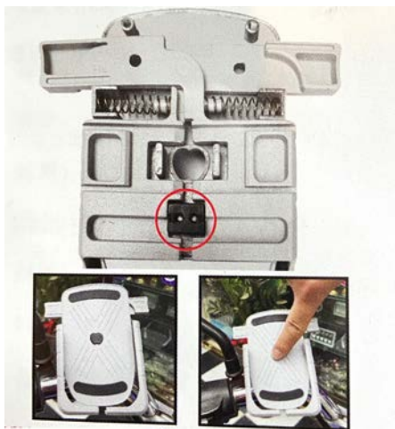
Fermeture des crans de serrage