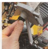
Serrer la visse