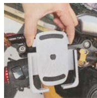
Appuyer sur le support pour ouvrir les crans de serrage