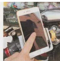
Placer votre téléphone